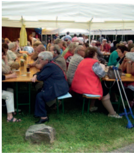
Es ist bereits Kult in Merkstein. Das alljährliche Kinder- und Familienfest zog

auch in diesem Jahr zahlreiche Gäste an. Der AWO-Ortsverein Merkstein schätzt, wenigstens 700 Besucher waren auf der Wiese an der Begegnungsstätte dabei. Hier war wiederum eine kleine Zeltstadt aufgebaut. Zahlreiche Kinderspiele lockten bei dem sommerlichen Fest. Es gab reichlich Auswahl bei Essen und Trinken. Ein Bierwagen gehörte auch dazu. Im Tagesraum wurde Kaffee und Kuchen gereicht. Über viele Stunden blieben die Teilnehmer bei der Feier und freuten sich über die Gesellschaft, das Angebot und die gute Unterhaltung. Die Kinder wurden mit einem kleinen Zug durch die Siedlung gefahren, konnten Enten angeln oder auf eine Torwand schießen. Rundum gelun-