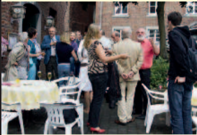
Das Konzept ging auf!

Obwohl das Wetter uns zunächst glauben ließ, die Feier fällt ins Wasser, klarte der